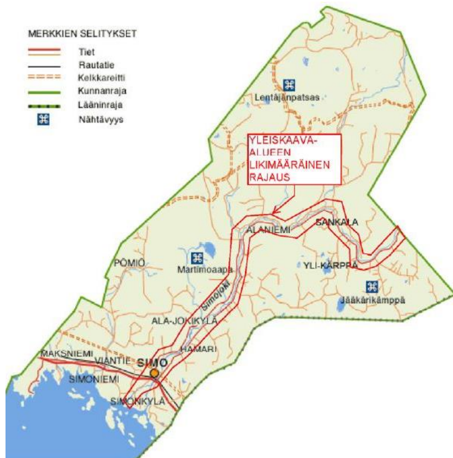
Kuva 1. Kaava-alueen seudullinen sijainti (Paikkatietoikkuna/MML)