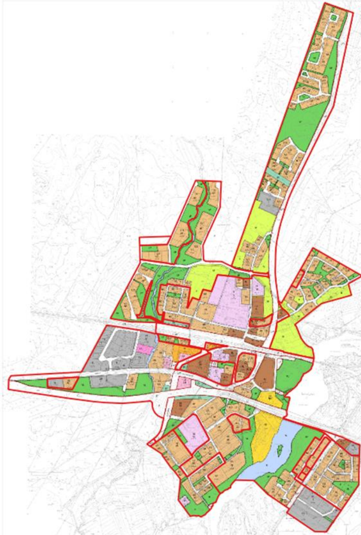
Kuva 6. Asemakylän asemakaava.

Suunnittelualueella ei ole voimassa tai vireillä olevia asemakaavoja. Yleiskaavan alue sivuaa Simon kuntakeskuksen kohdalla Asemakylän asemakaava-alueita. Kaava on vahvistettu useilla eri päätöksillä. Viimeinen muutos on hyväksytty 6.2.2017.