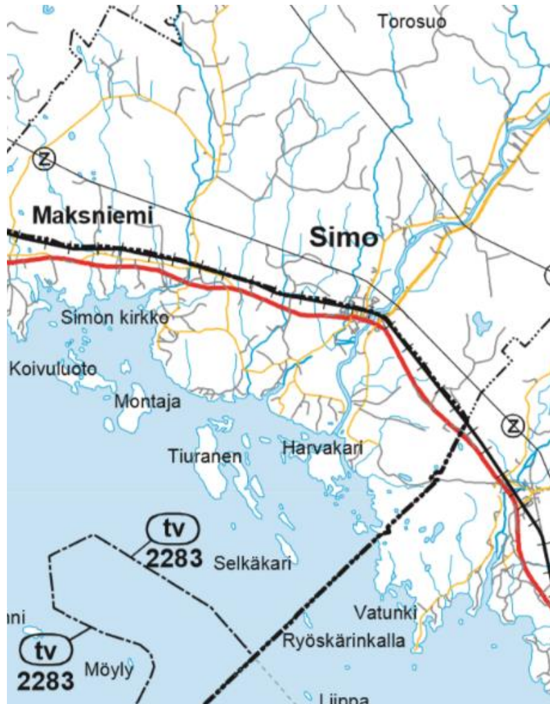
Kuva 4. Ote Lapin meri- ja rannikkoalueen tuulivoimakaavasta.