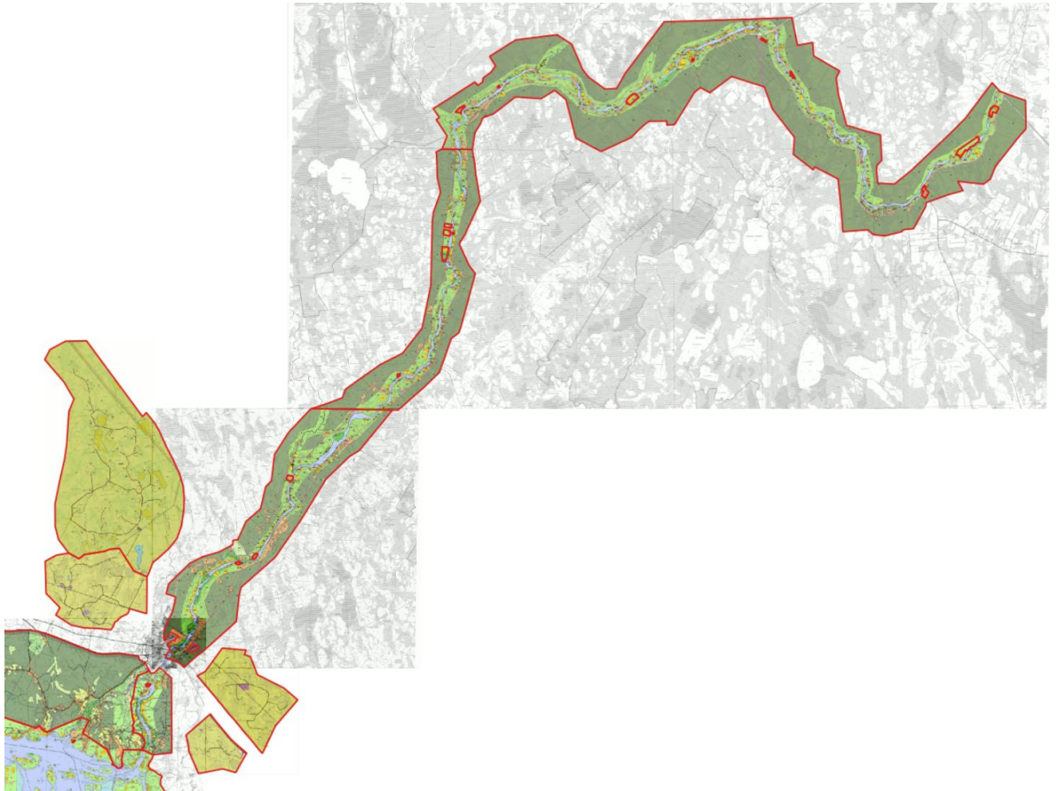
Kuva 5. Simon kunnan yleiskaavayhdistelmä