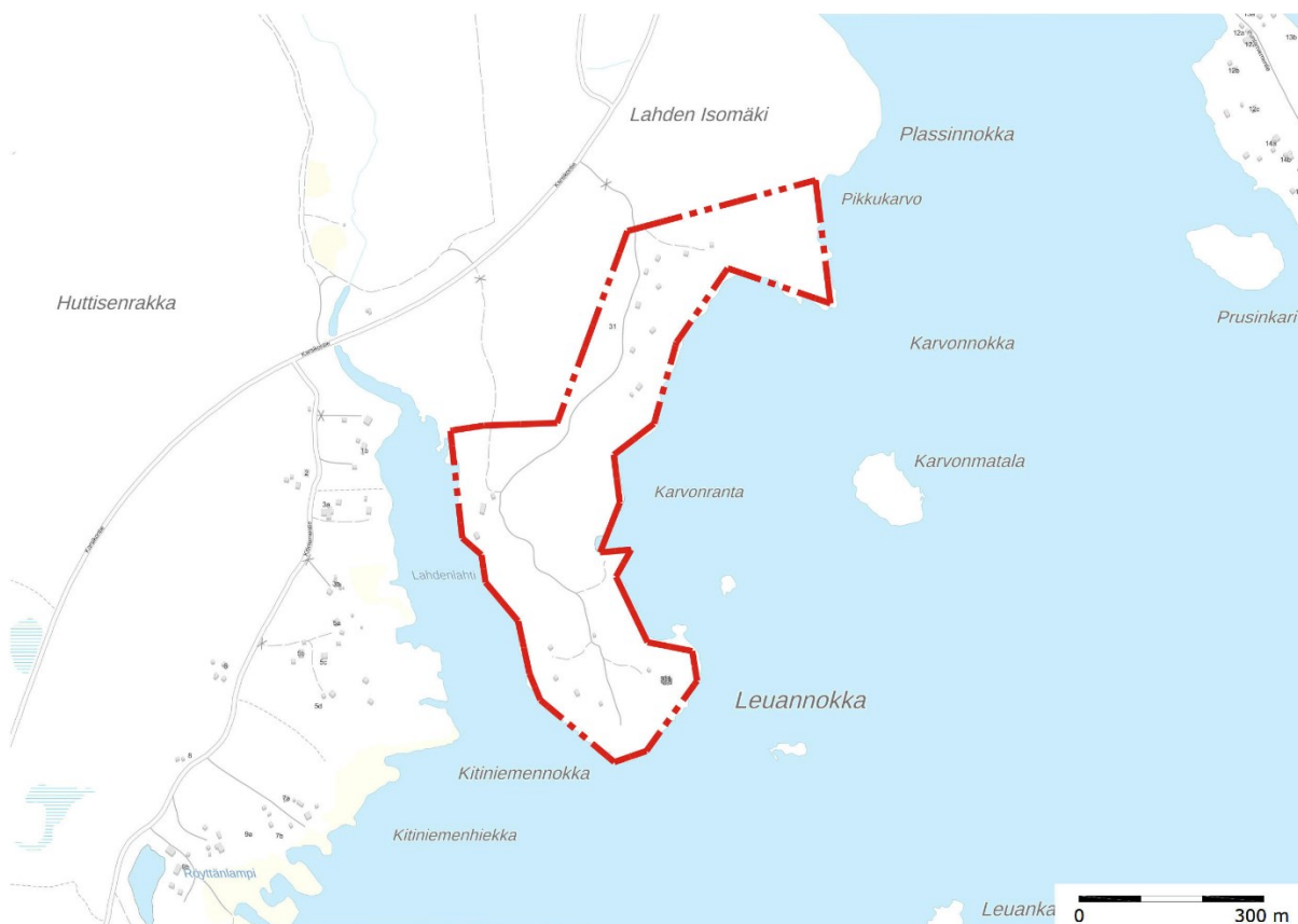
Kuva 1. Asemakaava-alueen sijainti. Kaava-alueen rajausta on esitetty punaisella pistekatkoviivalla.

Asemakaava-alueen sijainti on esitetty kuvassa 1. Alue sijoittuu Lapin maakuntaan, noin 12 kilometriä Simon keskustaajamasta länteen Perämeren rannalle, Kemintien etelä- ja Karsikontien itäpuolelle.