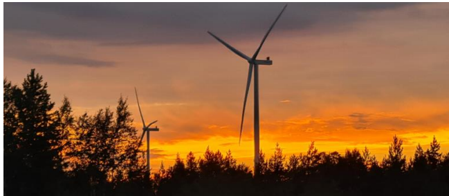
Leipiö III/Sarvisuon uusia voimaloita alkusyksyn illassa.

Elokuu on ollut hienon aurinkoinen, tuulinen ja lämmin. Ukkosmyrskyjä on ollut myös parin vuoden edestä, mutta onneksi suurempaa vahinkoa ei ole aiheutunut.