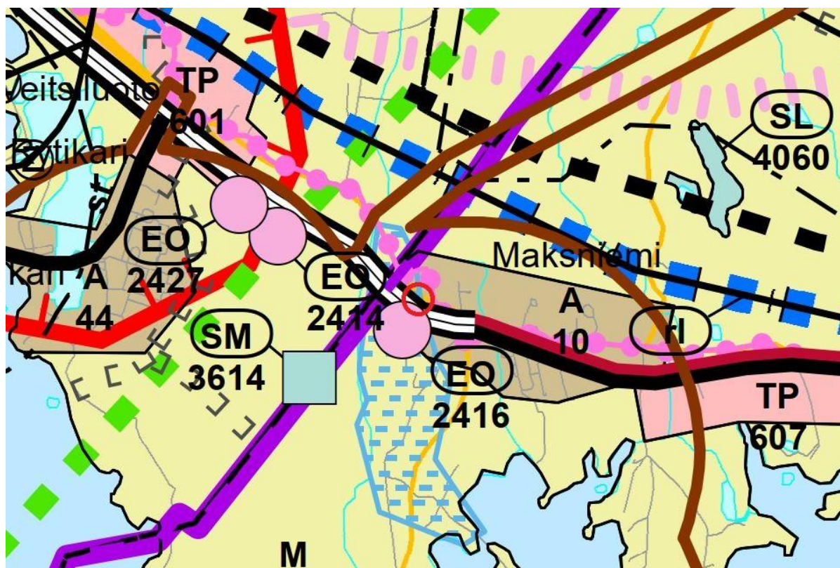
Kuva 2. Ote Länsi-Lapin maakuntakaavasta. Kaava-alueen sijainti on esitetty punaisella ympyrällä.

Asemakaava-alueella on voimassa Länsi-Lapin maakuntakaava, joka on hyväksytty Lapin maakuntavaltuustossa 26.11.2012 ja vahvistettu ympäristöministeriössä 19.2.2014.