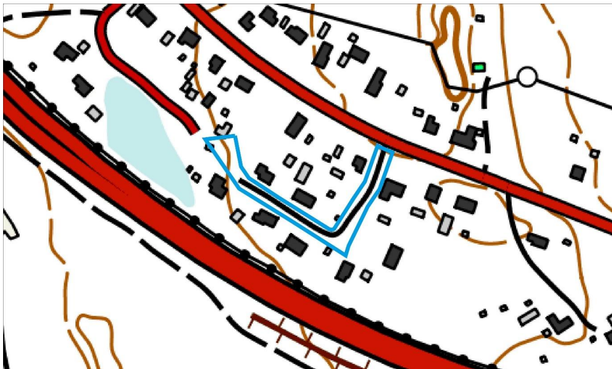
Kuva 1. Asemakaavamuutosalueen sijainti. Kaava-alueen raja- us on esitetty turkoosilla viivalla.

Asemakaava-alueen sijainti on esitetty kuvassa 1. Alue sijoittuu Maksniemen Marostenmäen alueelle, Kemintien ja Marostenmäentien välille.