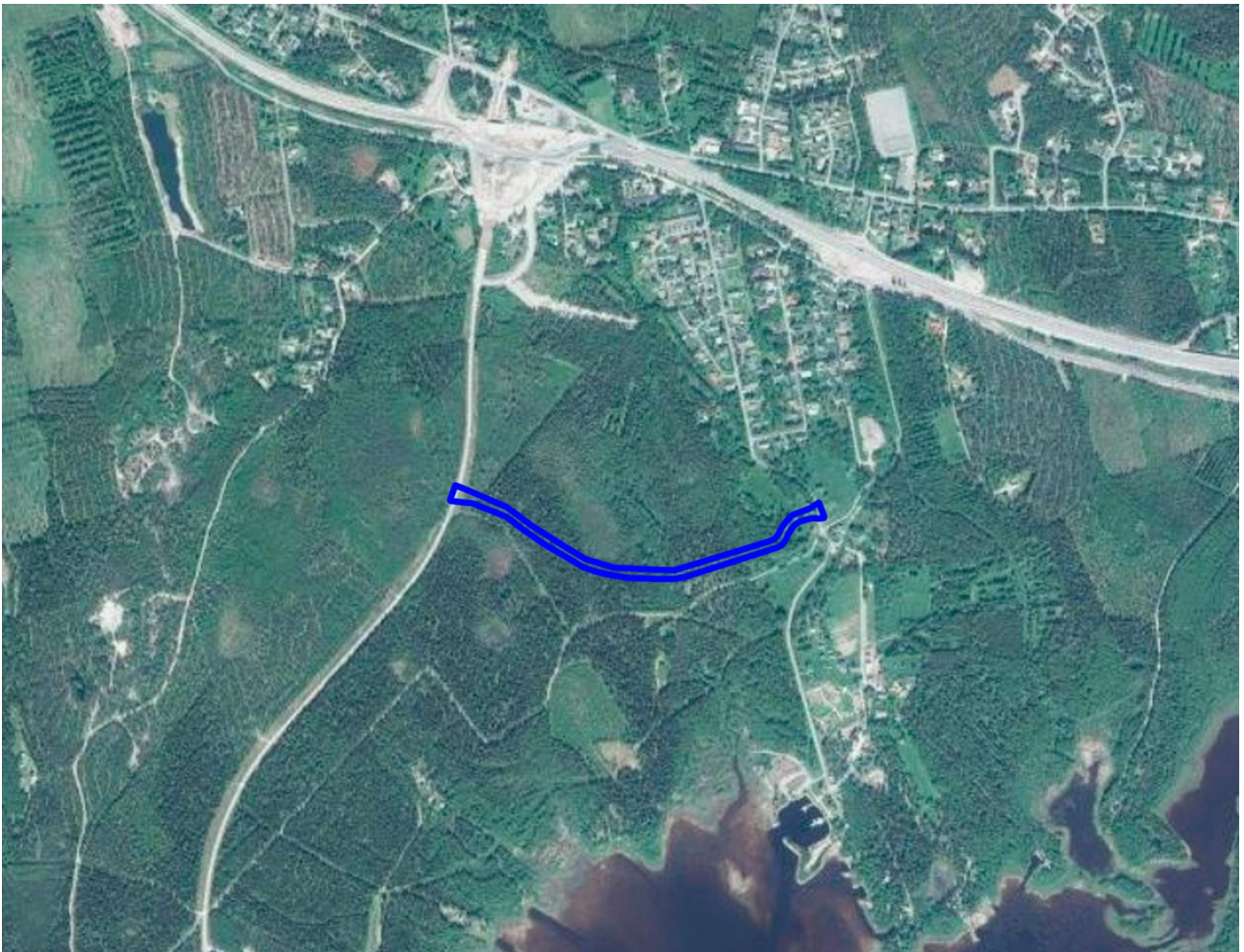
Kuva 1. Suunnittelualueen sijainti.