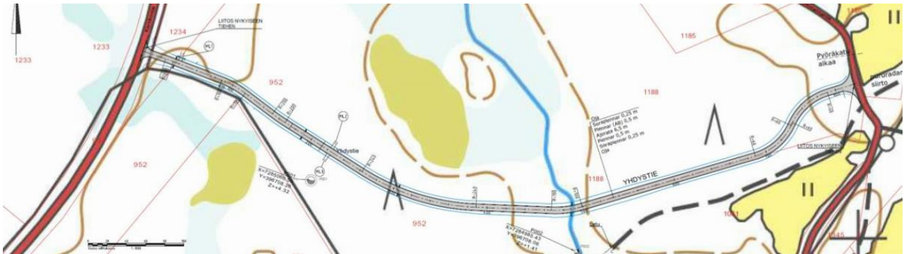
Kuva 2. Yhdystien suunnitelma aluerajauksineen.

Asemakaavamuutoksen laadinnan kohteena on noin 1,25 hehtaarin alue Karsikontien ja Saarenrannantien välisellä metsäalueella.