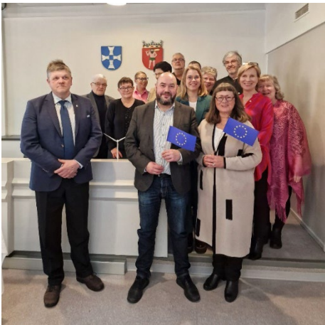
Lapin liitto kävi maakuntajohtajan kuntakerroksella Simossa 14.3.2024

Kunnan asukasluku pienen edellisvuodesta 49 henkilöllä. Meitä sisukkaita simolaisia oli vuodenvaihteessa 2828.