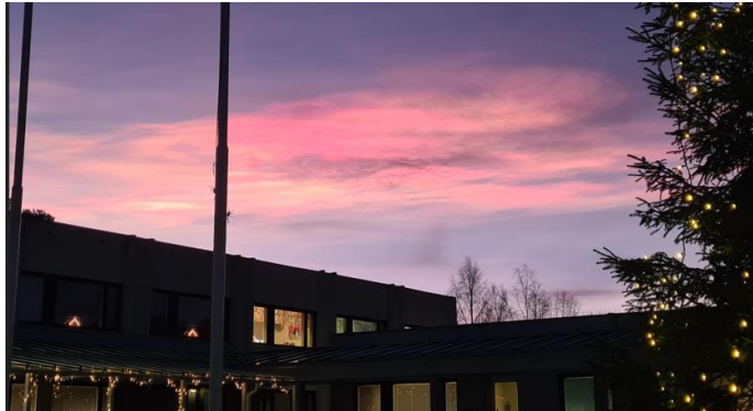
Kauniit helmiäispilvet joulukuussa 2024 kunnanvirastolla.

Uusi vuosi 2025 tuo tullessaan mm. demokratian kannalta erittäin tärkeät kunta- ja aluevaalit. Kunnanvaltuustoon valitaan 17 valtuutettua. Aluevaaleissa Laphan valtuustoon valitaan 59 jäsentä. Äänestämään pääsee ennakkoon kunnanvirastolla 2.-8.4. Varsinainen vaalipäivä on sunnuntaina 13.4., jolloin äänestetään omalla äänestysalueella joko asemalla kunnanvirastolla tai Maksniemessä koululla. Uusi valtuusto aloittaa työnsä 1.6.2025.